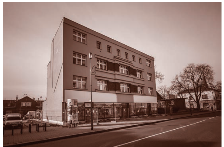
Na sklonku listopadu finišovala rekonstrukce fasády domu v ulici Jeremenkově 16.