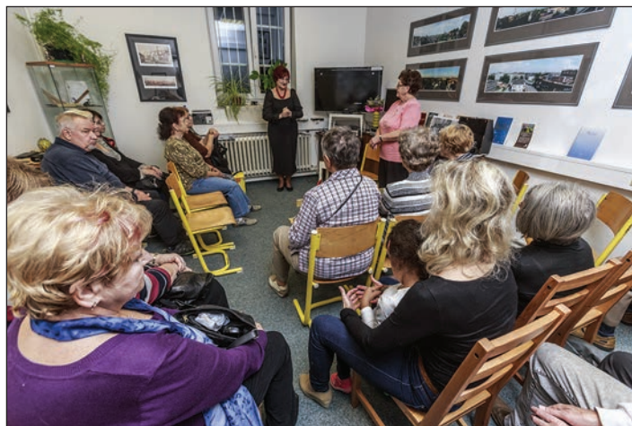
Vzpomínky na vítkovické ochotníky zaujaly pozornost několika generací.